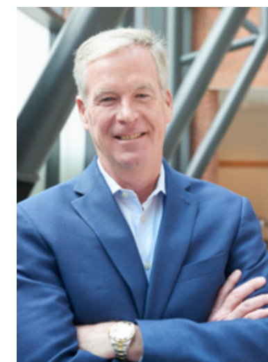
Steve Cahillane Presidente e CEO

Nossa Visão: Ser a a melhor fonte de nutrição no mundo com o melhor desempenho, explorando toda a capacidade de nossas marcas diferenciadas e de nossa apaixonada equipe.