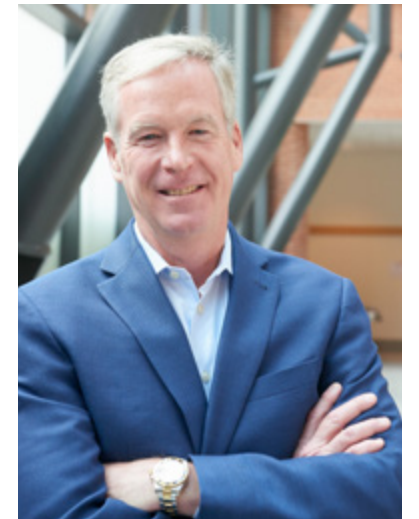
Стив Кахиллан Президент и генеральный директор

Наше видение: быть самым эффективным в мире производителем сухих завтраков, полностью раскрывая весь потенциал наших дифференцированных брендов и наших полных энтузиазма сотрудников.